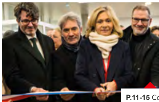
P.11-15 Coup de projecteur