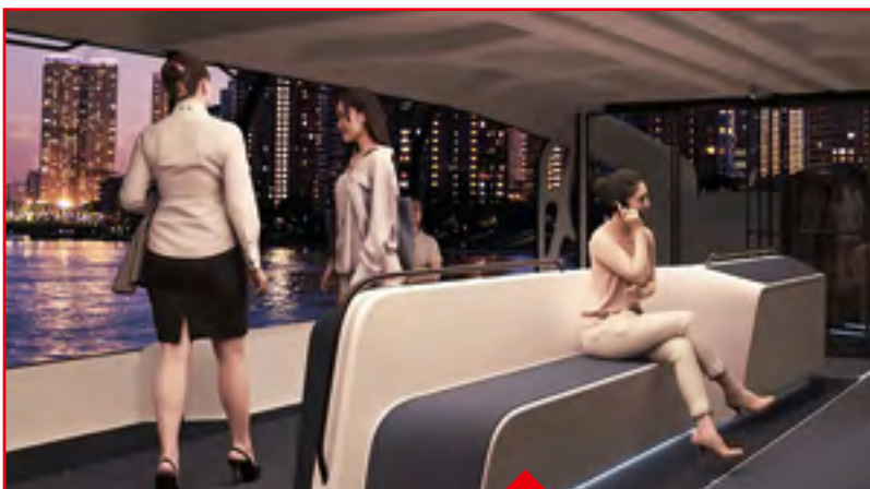
P.16 Décryptage : Une navette fluviale à Ris-Orangis en 2024, une première mondiale !