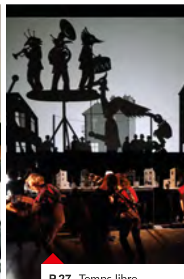
P.27- Temps libre