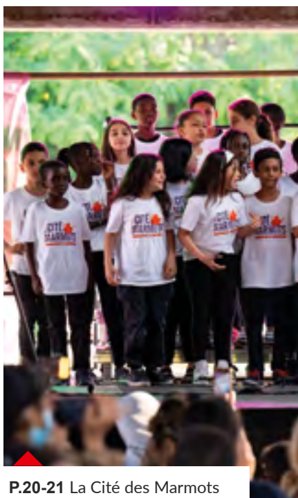
P.20-21 La Cité des Marmots