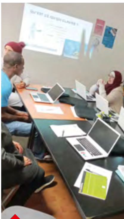
P.23 Vers l'égalité numérique