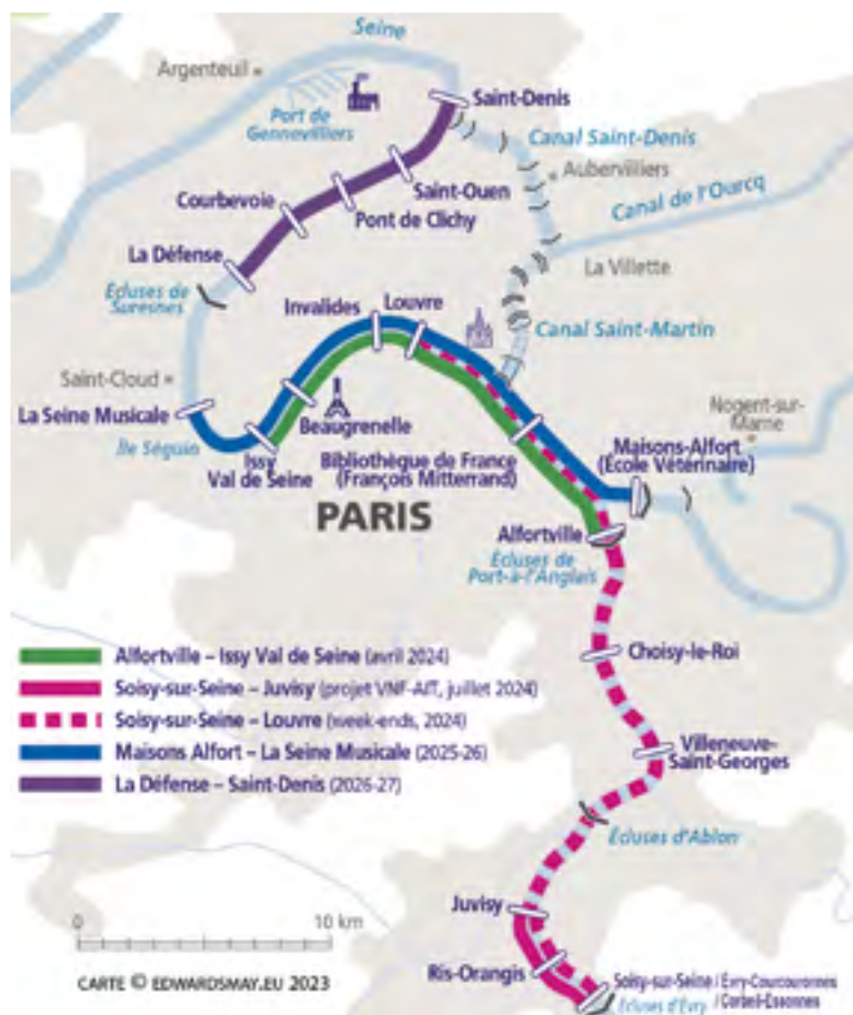
Projection des ouvertures des lignes par RiverCat.

Ses 4 bateaux, 100 % électriques, de 15 m de long, pourront accueillir à bord 50 passagers et des vélos, permettant ainsi aux voyageurs de rejoindre la gare RER de Juvisy. Durant toute la période des JO, soit 47 jours, ces navettes seront gratuites pour les utilisateurs.