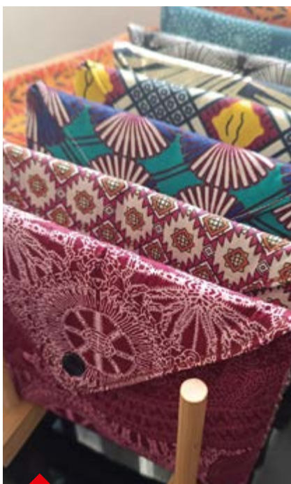
P.25 - By Jee, du wax, de la couleur et du peps, à l'image de Gina !