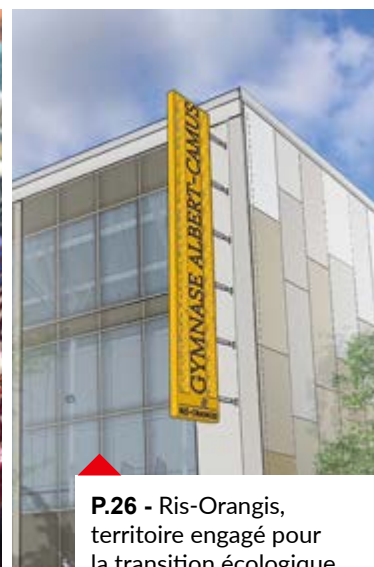
P.26 - Ris-Orangis, territoire engagé pour la transition écologique