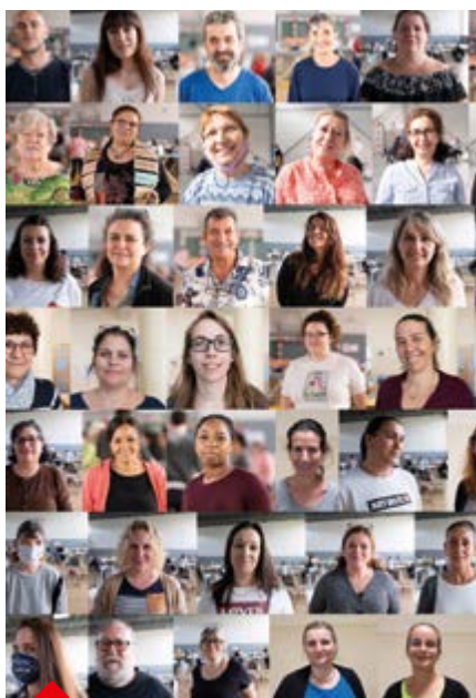
P.22 - L'Atelier rissois s'agrandit de fil en aiguille