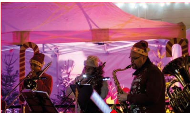
P.16 Noël, cette magie qui nous rassemble !