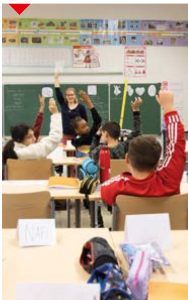
P.4 à 10 - L'essentiel