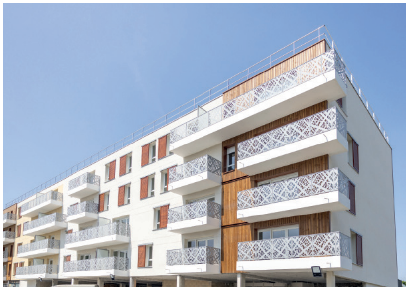
CDC Habitat vient de livrer une nouvelle résidence, Villa Regia, raccordée au réseau de chaleur urbain, alimenté par la géothermie.

Avec un montant total de 4,7 millions d'euros – 36 000 euros par logement –, ces travaux permettent d'améliorer le cadre de vie des habitants et surtout de réduire la consommation énergétique des logements, le DPE passant de la lettre D à C.