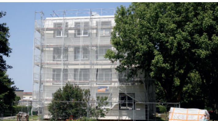
Dans la résidence des Castors, les travaux vont être terminés d'ici la fin de l'été.