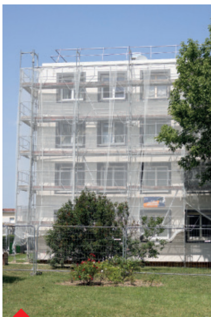
P.22-23 - La rénovation énergétique des copropriétés se poursuit !