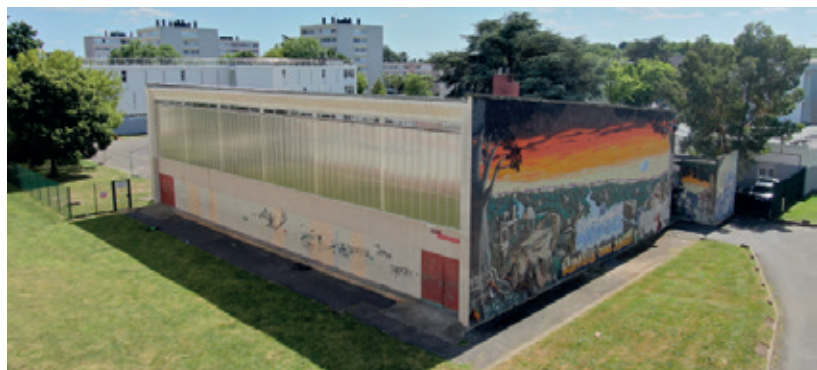
Le gymnase de la Ferme du Temple va être entièrement rénové, avec une isolation thermique, sur le modèle du gymnase Albert-Camus.