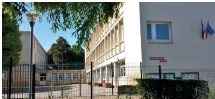
L'école Ordener va connaître d'importants travaux d'isolation thermique et de réfection de sa toiture.