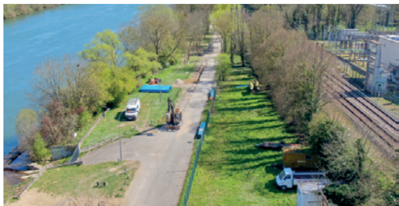
Cet été va marquer le début des travaux de renaturation de nos berges de Seine.

Pour les écoles, l'été est la saison des travaux : nos écoliers n'étant plus présents... C'est d'abord Ordener qui va connaître plusieurs chantiers. Côté élémentaire, des sanitaires et des cabines vont être créés. Mais c'est l'ensemble du groupe scolaire qui va connaître d'importants travaux d'isolation thermique, la réfection de la toiture et le changement des menuiseries. Enfin, toujours dans les écoles, deux réfectoires vont être rénovés, celui de l'école Orangeris et celui de l'école Ferme du Temple. ■