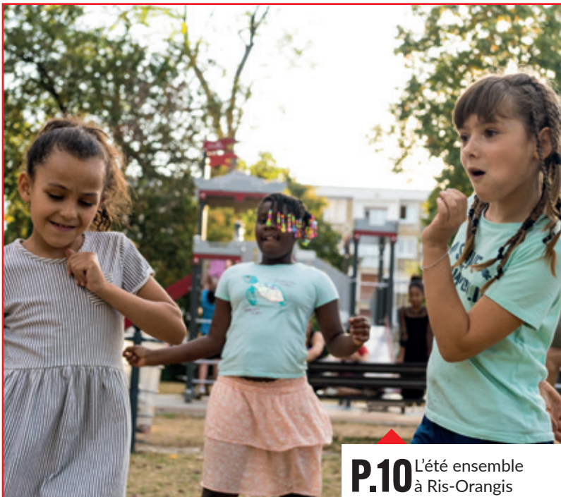
P.10 L'été ensemble à Ris-Orangis