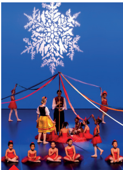
P.25 à 28 - Coup de projecteur