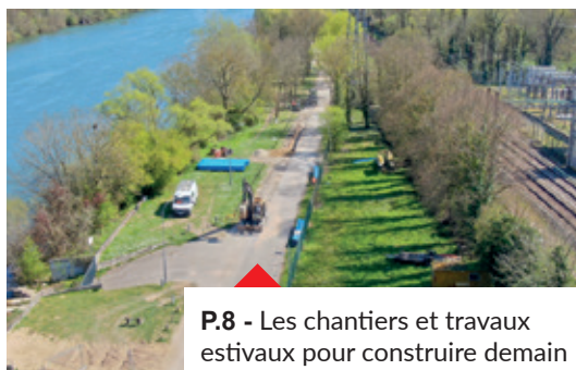
P.8 - Les chantiers et travaux estivaux pour construire demain