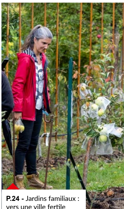
P.24 - Jardins familiaux : vers une ville fertile