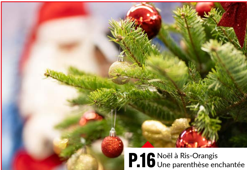
P.16 Noël à Ris-Orangis Une parenthèse enchantée