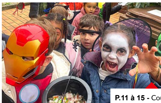
P.11 à 15 - Coup de projecteur