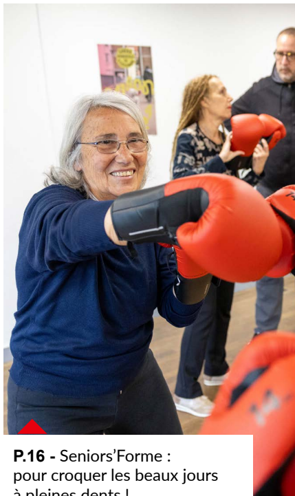
P.16 - Seniors'Forme : pour croquer les beaux jours à pleines dents !