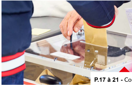
P.17 à 21 - Coup de projecteur