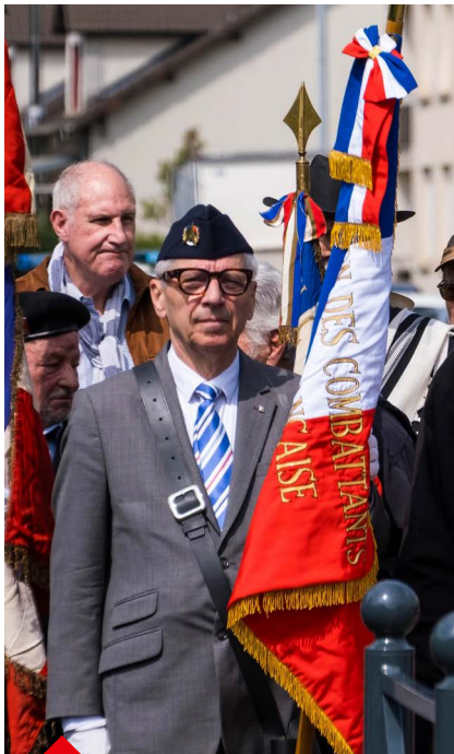
P.24 - Semaine de la Mémoire de la Déportation : témoigner pour ne jamais revivre l'horreur