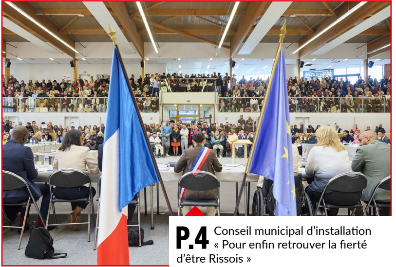
P.4 Conseil municipal d'installation « Pour enfin retrouver la fierté d'être Rissois »