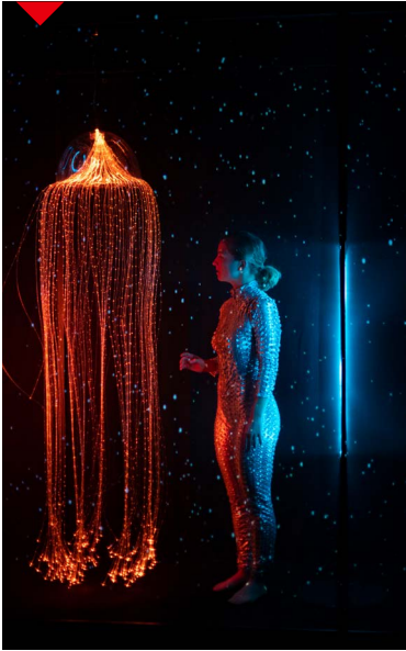
P.9 à 14 - L'essentiel