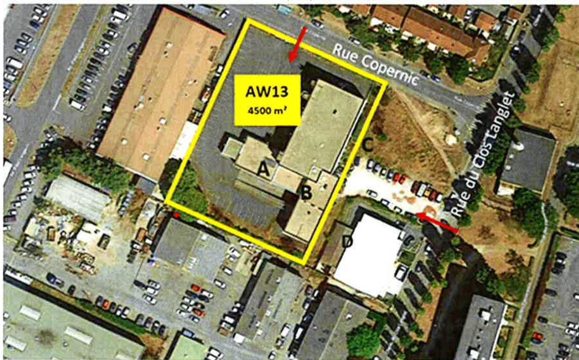
Vue aérienne du site – Parcelle AW13

La commune a acquis, par un acte authentique du 12 juillet 2023, l'ensemble immobilier situé sur les parcelles AW 13 et AW14 auprès de la SCI LINK afin d'y réaliser un nouveau centre Technique municipal, dont l'Avant-Projet Détaillé a été adopté par délibération du 19 novembre dernier.